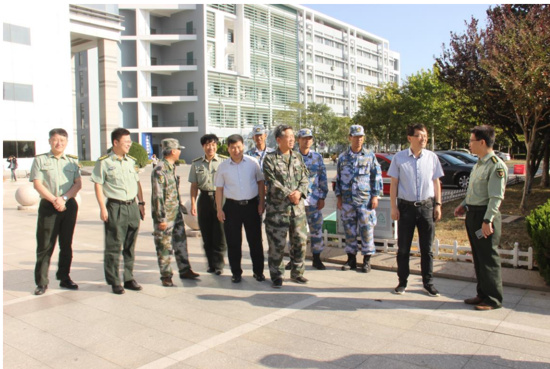
来自学校领导的关心