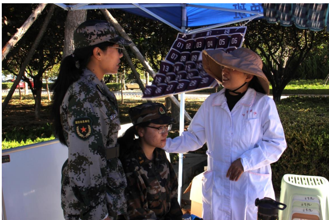
永远有人为孩子们担心