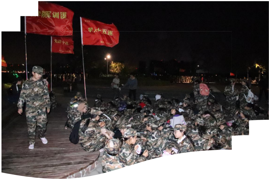
文学院六团学生有序地进行原地休息