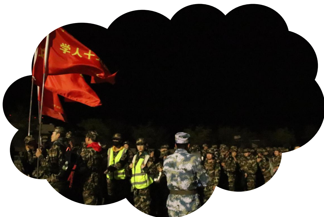
文学院六团师生拉练路上