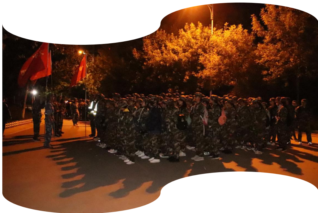
文学院六团师生于南门集合