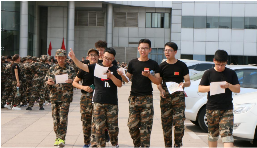
文学院六团学生或独自行动，或多人组队，进行定点打卡

手机 APP 进行定位。本次训练对学生来说是一次紧张又刺激的体验，不仅能锻炼其体力，还考验其应变能力。最激动人心的部分莫过于冲向终点线的时刻,周围呐喊助威声更加点燃了现场的气氛，走在校园里的其他学生也不禁驻足观看。