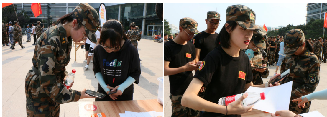
文学院六团学生在起点领取定向越野相关资料