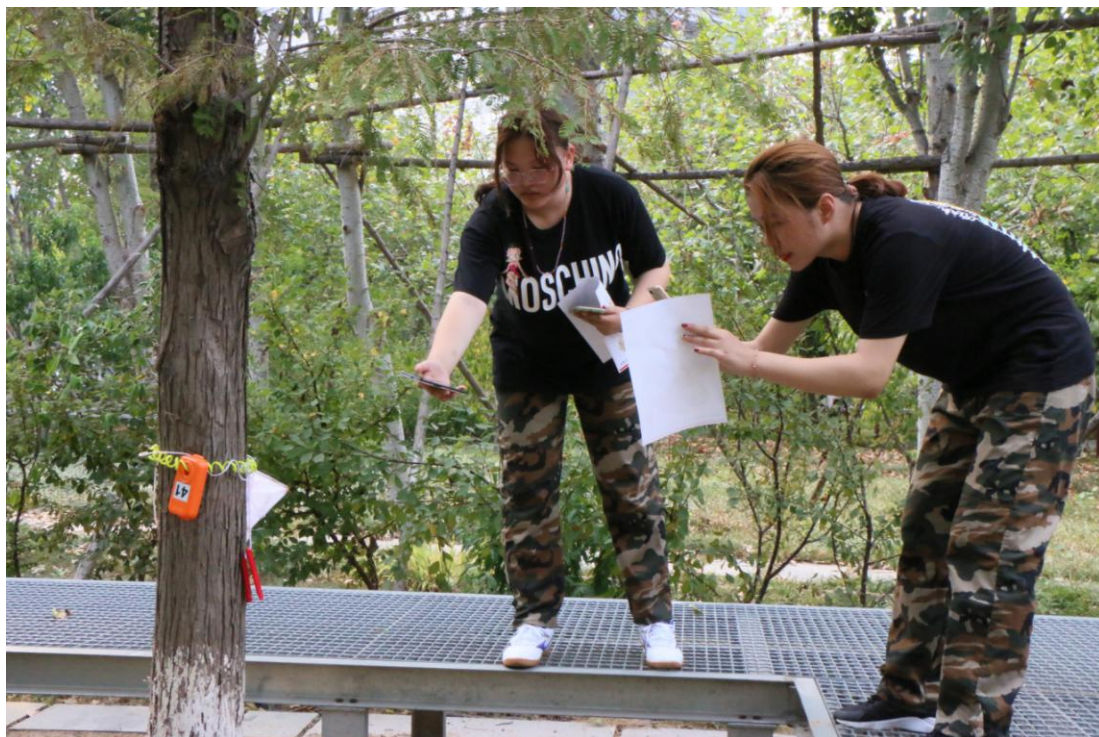
“谁说女子不如男”，文学院六团女生进行定点打卡