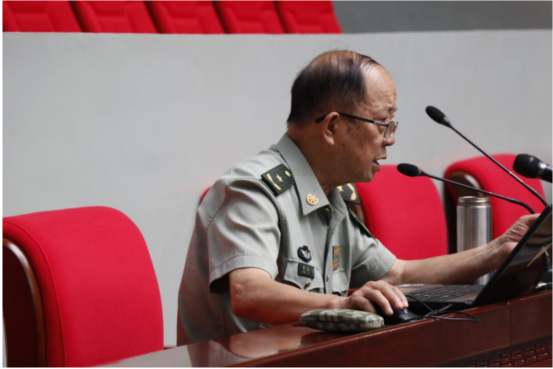
文学院六团全体参加国防大讲堂